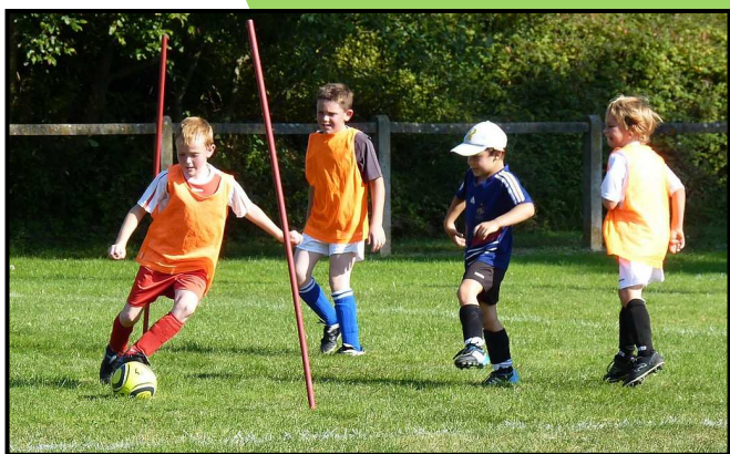
Les débutants en action

Les effectifs 2010 / 2011 restent stables avec plus de 70 licenciés. Pour ce qui est du fonctionnement, nous restons autonomes en Débutants et Poussins, et pour les catégories supérieures nous poursuivons l'entente avec le club de Billom.