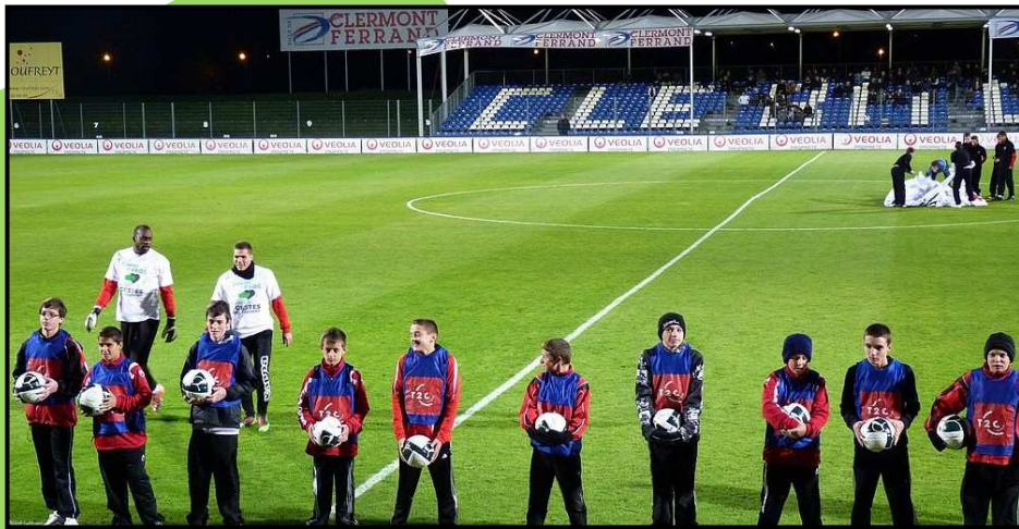
Les U15 à l'honneur au Clermont-Foot Auvergne 63

Le partenariat qui lie le FJEPB au Clermont-foot a permis aux jeunes du club d'assister à la rencontre Clermont / Metz au stade Gabriel Montpied le 29 octobre dernier. De plus, l'équipe des U15 a eu la chance d'être choisie pour jouer le rôle de «ramasseurs de balles» lors de cette rencontre. L'occasion pour nos jeunes footballeurs de fouler la pelouse au contact de joueurs professionnels !